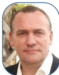
Jacques Sces Centraux