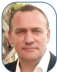
Jacques Sces Centraux