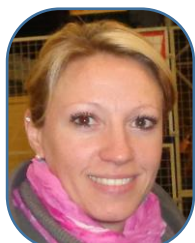
Ingrid E. Sces Centraux