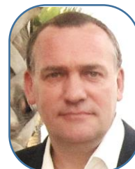
Jacques Sces Centraux