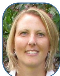
Ingrid P. Sces Centraux