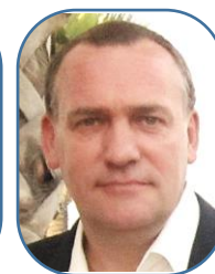
Jacques Sces Centraux