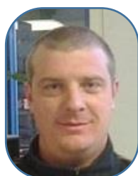
Olivier Nord Champagne